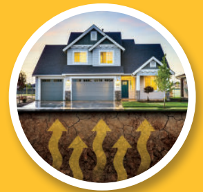
Monitoreo de Intrusión de Vapor